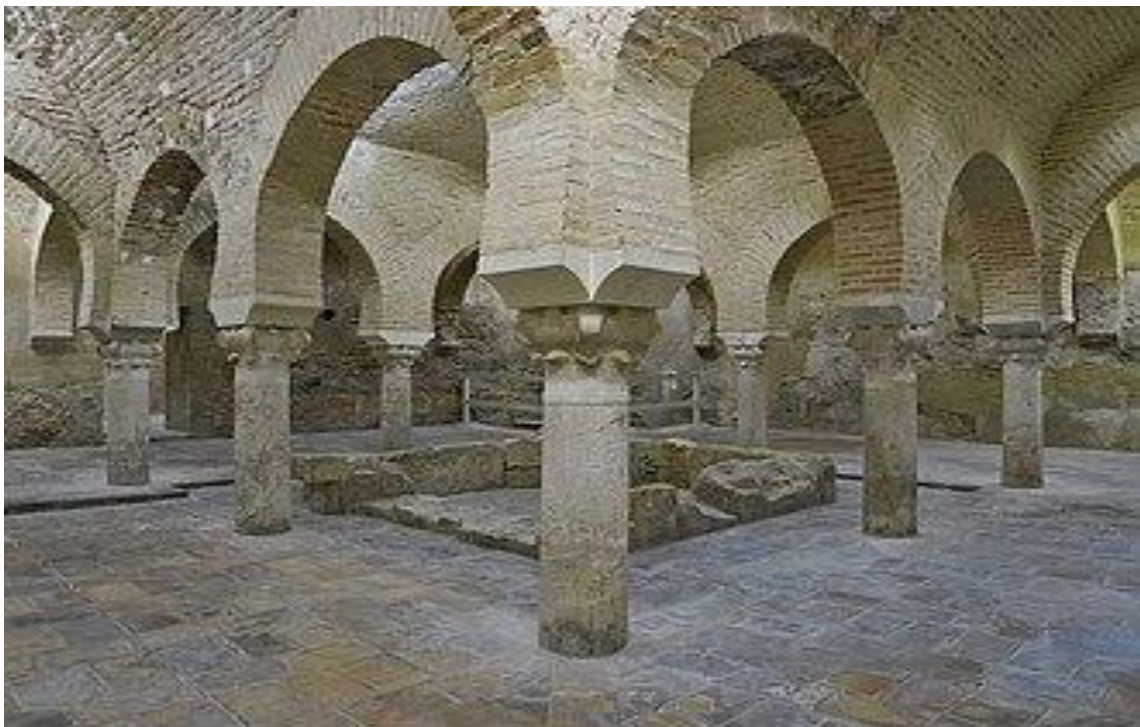
Baños árabes en Jaén

22 Y 23 DE NOVIEMBRE 2025 (SÁBADO Y DOMINGO)